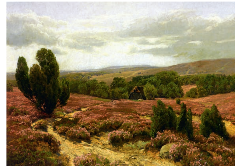
Carl Coven Schirm, Blühende Heidelandschaft , um 1925, © Albert-König-Museum