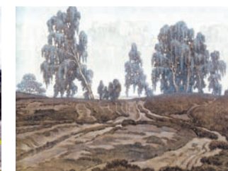
Albert König, Birken in der Heide , um 1930, © Albert-König-Museum