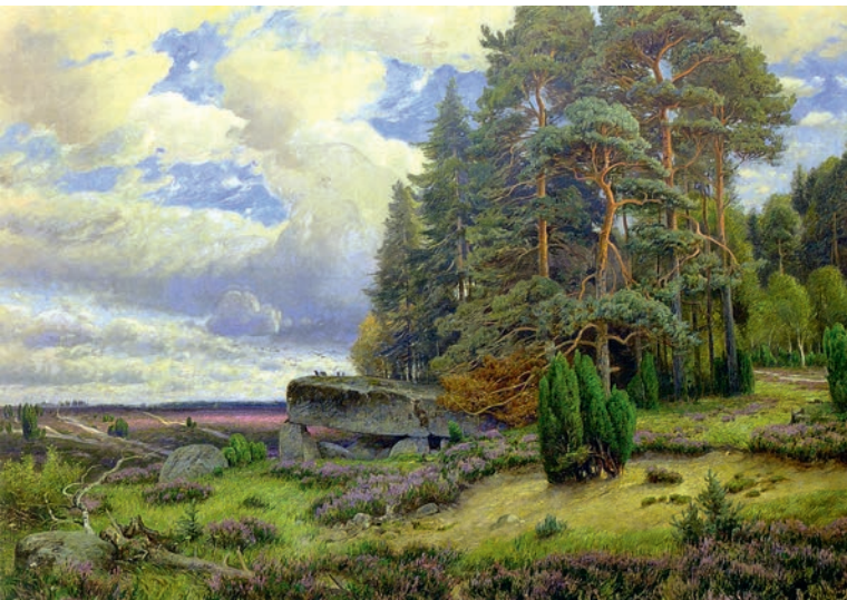
Paul Koken, Heidelandschaft , um 1900

Erst durch die Romantik setzte Mitte des 19. Jahrhunderts ein Umdenken ein. Als Gegenpol zur industriellen Entwicklung und städtischen Expansion lernte man nun, die vermeintlich unberührte Natur der Heide als Naherholungsziel zu schätzen. Die durch Aufforstungen und modernen Ackerbau spürbar dezimierten Heideflächen erschienen plötzlich erhaltenswert und Naturschutzvereine wurden