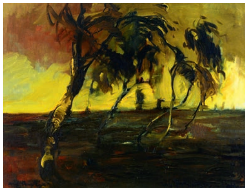
Walter Polzenhagen, Birken im Sturm , 1945, © Albert-König-Museum

Buchen Sie Ihre persönliche Führung durch die Ausstellung unter 04183/5112, Di–So , € 55