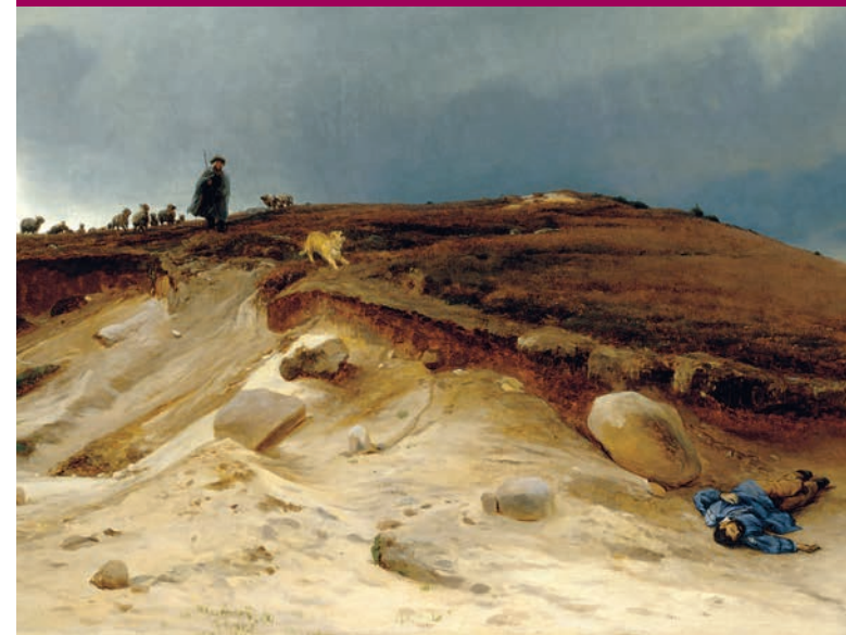
Eugen Bracht, Der Erschlagene , 1877, © Sammlung Sander/The Sander Collection