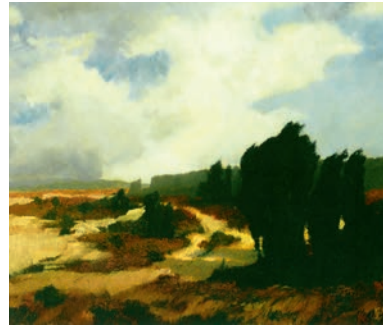
Rudolf Hermanns, Wacholdergruppe , um 1910, © Albert-König-Museum