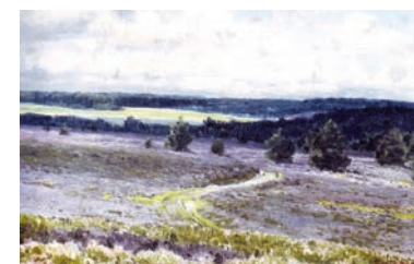
Richard de Bruycker, Ein heiterer Tag , 1922, © Albert-König-Museum